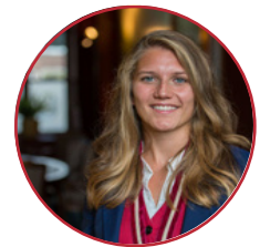
Sophie Bestuur 75

leden over te nemen, mochten deze niet lukken. De Voorzitter houdt extra tijd in de week vrij om overige taken op zich te nemen en zo te voorkomen dat taken niet op tijd af zijn. Als Voorzitter neem je deel aan verschillende externe overleggen, zoals de overleggen met alle voorzitters van de studieverenigingen van de FSW, overleggen met de studieverenigingen van Leiden, landelijke overleggen met alle studieverenigingen Psychologie in Nederland en gesprekken met de opleidingsdirecteur van Psychologie. Het voorzitterschap is erg divers, omdat je naast deze taken ook ruimte hebt om aan verschillende taakgroepen binnen het bestuur deel te nemen en je te ontfemen over commissies. Dit alles maakt het voorzitterschap een unieke, gevarieerde functie waar je ontzettend veel van kan leren! Je bent altijd welkom al je vragen aan mij te stellen in het hok.